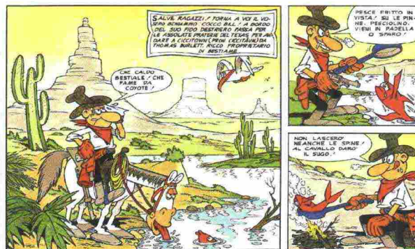
Vignette di Jacovitti per Cocco Bill

BRA (CN) - È stata inaugurata il 30 giugno, in occasione dell'apertura del festival Artico , e sarà allestita fino al 27 agosto la mostra Tutto Jacovitti , a Palazzo Mathis per il ventennale dalla scomparsa del fumettista e in contemporanea all'anniversario dei sessant'anni dalla creazione del celebre personaggio Cocco Bill. Lo spazio espositivo è quello del piano nobile di Palazzo Mathis, composto da cinque sale. Quattro di queste sono occupate dalle tavole originali di Jacovitti, mentre la quinta vede esposti dei disegni originali realizzati da giovani fumettisti e illustratori provenienti da tutta Italia, per omaggiare il maestro del fumetto. L'esposizione braidese, a cura di Silvia Jacovitti e Dino Aloï, nasce in collaborazione con Switch on Future e il comune di Bra e rappresenta la prima tappa dell'esposizione prima di proseguire il tour nelle principali città italiane. Info: www.switchonfuture.it