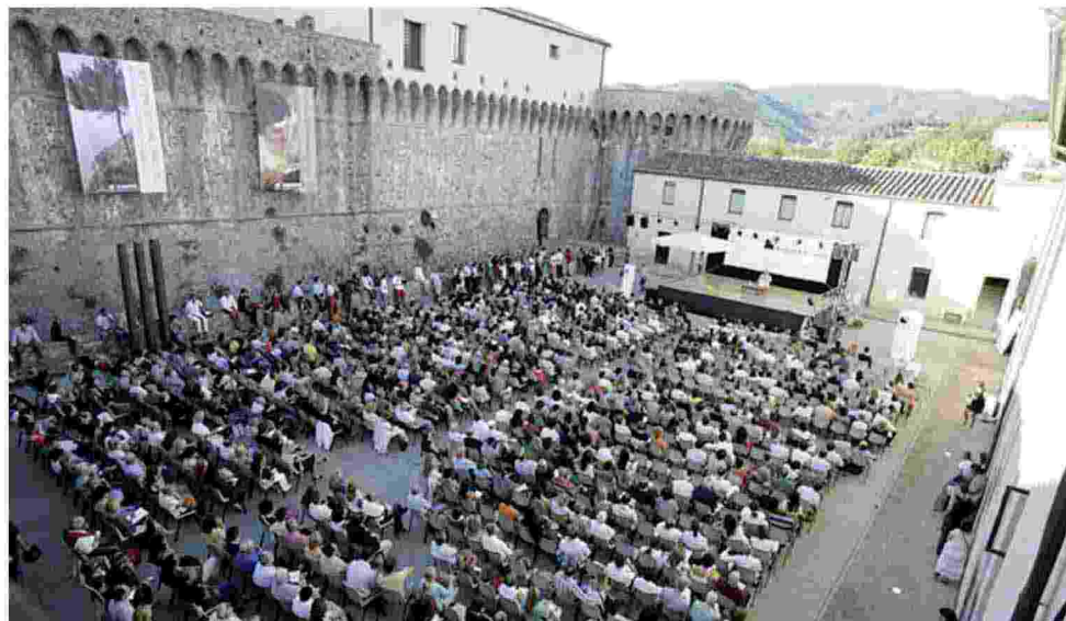
SARZANA. Un'immagine della precedente edizione del Festival della Mente , al via domani.

Si apre domani a Sarzana il Festival della Mente . Un percorso trasversale per rivedere l'integrazione delle culture e dei popoli ricordandosi dell'esempio di uomini come Camus, l'Abbé Pierre, Bonhoeffer, Unamuno, don Milani. È quell'opera umana «da compiere» di cui parlò Teilhard de Chardin