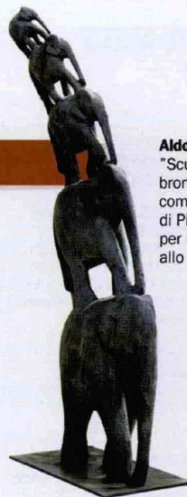
Aldo Mondino, "Sculptura un corno", bronzo, opera esposta nel complesso di Sant'Agostino di Pietrasanta, per la mostra dedicata allo scultore.

NAPOLI Tra segno e forma. La rappresentazione del potere Esposizione delle opere dei 13 artisti selezionati nella prima edizione del Premio per le arti figurative In Form of Art 2010. Complesso Monumentale di San Lorenzo Maggiore, via dei Tribunali 316. Tel. 081/2110860. Orario: 10-20 da lunedì a venerdì. Ingresso: libero. Fino al 23/10/2010.