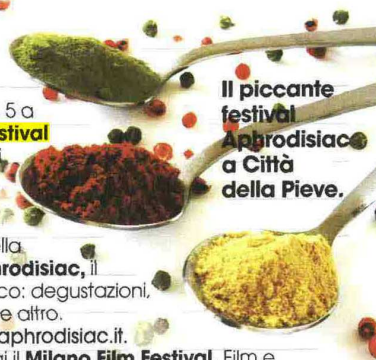
Il piccante festival Aphrodisiac a Città della Pieve.

Martedì 28 Carmen Consoli e la poetessa Joumana Haddad sono protagoniste di Adriatico Mediterraneo , festival della cultura internazionale ad Ancona fino al 5 settembre. Info: www.adriaticomediterraneo.eu .