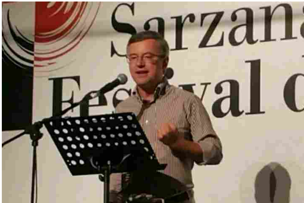
Alessandro Barbero in una delle passate edizioni del Festival della Mente

Appuntamento imprescindibile per i frequentatori del Festival della Mente di Sarzana è quello con la trilogia dello storico Alessandro Barbero, che chiude ciascuna giornata del festival, come di consueto, in Piazza Matteotti alle ore 22.45.