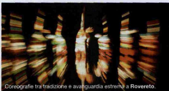
Coreografie tra tradizione e avanguardia estrema a Rovereto.

ANDRIA (BA) Il teatro come non lo avete (quasi) mai visto. Sono 40 le compagnie internazionali, raramente presenti nei calendari italiani, che calcheranno i palcoscenici della città. Festival Castel dei Mondi , dal 26/8 al 5/9, www.casteldeimondi.it