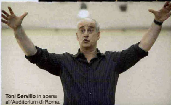
Toni Servillo in scena all'Auditorium di Roma.