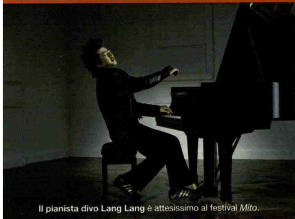
Il pianista divo Lang Lang è attesissimo al festival Mito.