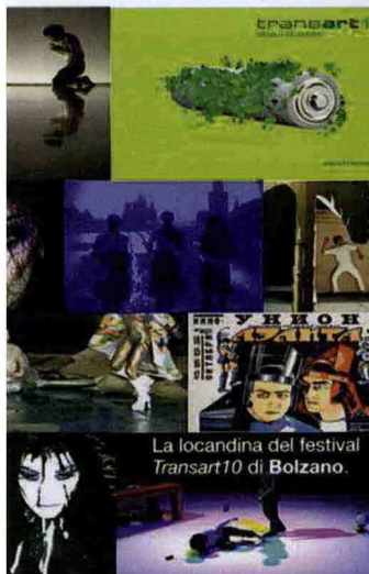
La locandina del festival Transart10 di Bolzano.