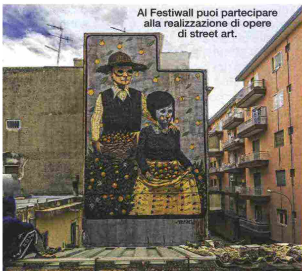
Al Festival puoi partecipare alla realizzazione di opere di street art.

>27 ottobre-6 novembre, festivalscienza.it