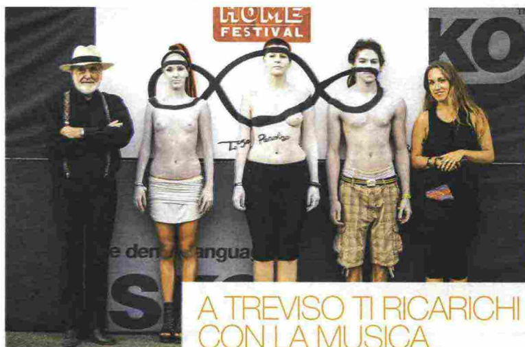
Una performance dell'Home festival di Treviso.

>30 agosto-11 settembre, orienteoccidente.it