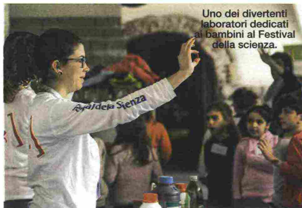
Uno dei divertenti laboratori dedicati ai bambini al Festival della scienza.