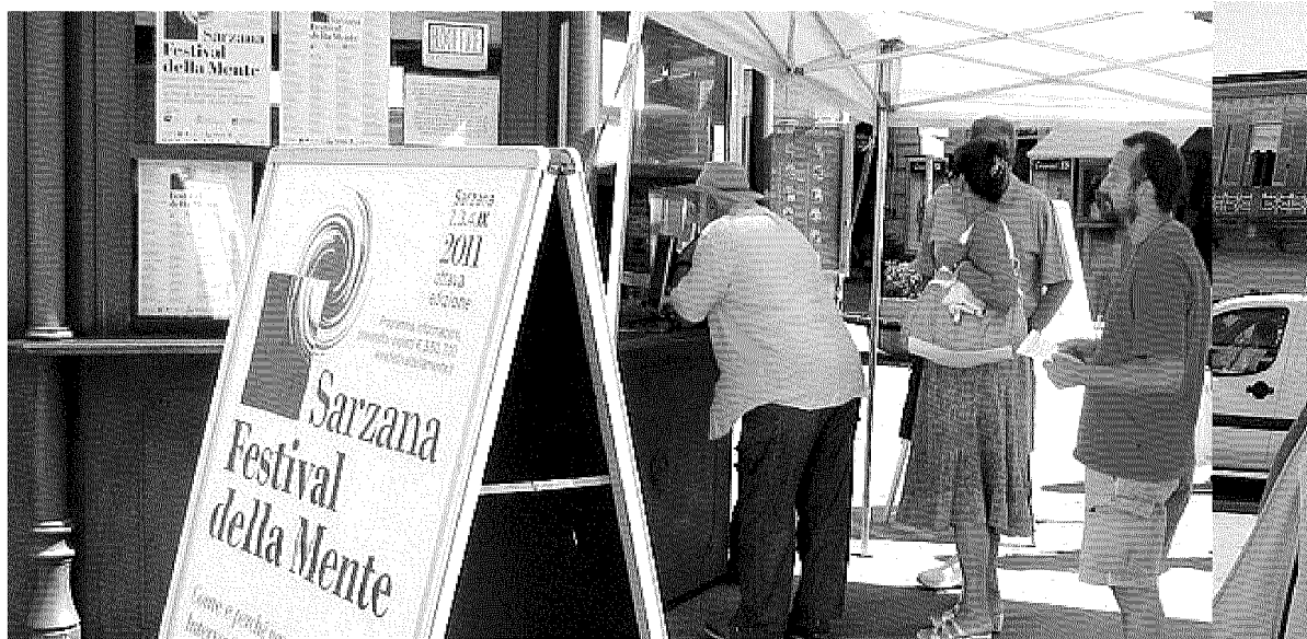
CORSA Prosegue la caccia al biglietto per gli incontri del «Festival della Mente» in programma dal 2 al 4 settembre