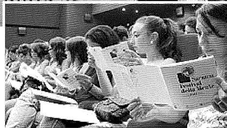
I GIOVANI Alcuni dei volontari del Festival della Mente di Sarzana