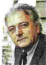
Lo psichiatra Gustavo Pietropoli Charmet (1938) è il direttore scientifico del Festival della Mente che sarà a Sarzana dal 4 al 6 settembre

Così, i percorsi che si intrecciano nella manifestazione — che ha la direzione scientifica di Gustavo Pietropoli Charmet e la direzione artistica di Benedetta Marietti — partono venerdì 4 settembre da un esempio antico in campo etico-politico, quello