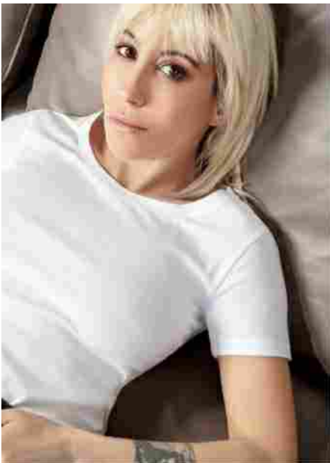
Malika Ayane e Irene Vallejo