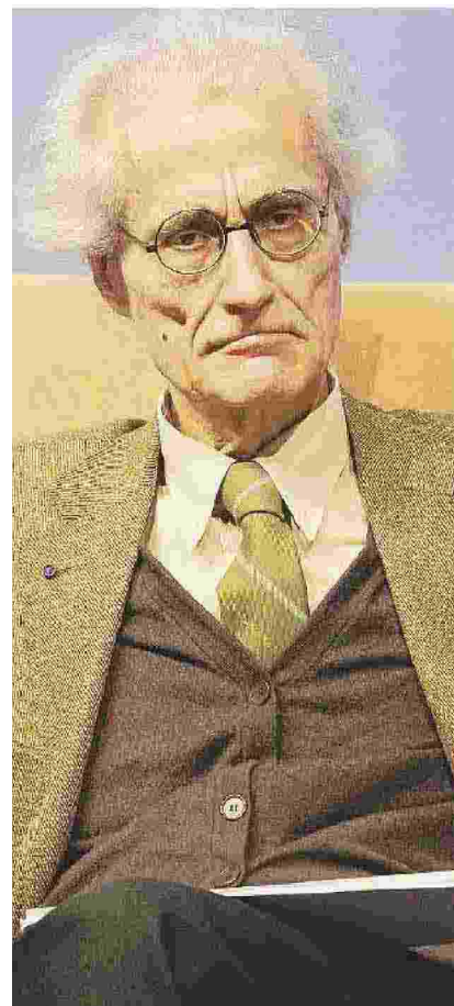
Luciano Canfora Storico e filologo

Se passa la riforma, avremo il contrario grottesco del Senato di Cicerone: tappezzeria nell'equilibrio costituzionale