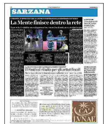
La giornalista del Tg3 Liguria a Sarzana e, a fianco, alcuni protagonisti della prima giornata