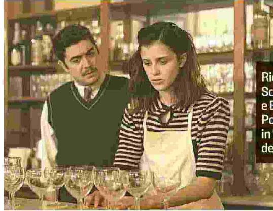
Riccardo Scamarcio e Benedetta Porcaroli in "L'ombra del giorno"