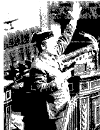
Il golpista Tejero con la pistola