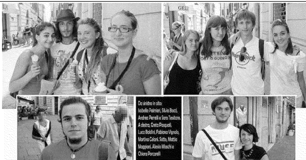
Alcuni dei 400 studenti impegnati come volontari al Festival della Mente. Ieri mattina alla Cittadella si è svolta la prima riunione operativa