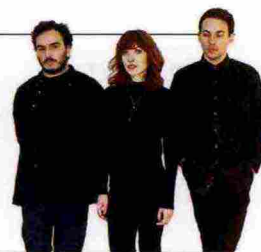
Magnolia Estate 2016, circolomagnolia.it

Due giorni con la musica indie: l'1 settembre, sul palco del Magnolia Estate, a Milano, i Daughter , Edward Sharpe & The Magnetic Zeros , Strumbellas . Il 2, Editors e Ministri .