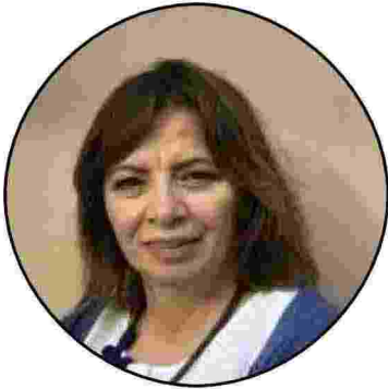
Luigina Mortari Epistemologa

La XXI edizione del Festival della Mente, diretto da Benedetta Marietti e promosso dalla Fondazione Carispezia e dal Comune di Sarzana, si svolgerà da venerdì a domenica 1 settembre. Aprirà il festival, venerdì alle 17.15 in piazza Matteotti, l'epistemologa Luigina Mortari, con la lectio "Sulla gratitudine, ovvero la gioia della cura". Tema del 2024 è, infatti, la gratitudine, ispirato a un saggio scritto del grande neurologo britannico è Oliver Sack nel 2014, dopo una diagnosi infausta: «A dominare è un senso di gratitudine. Ho amato e sono stato amato; ho ricevuto molto, e ho dato qualcosa in cambio. Più di tutto sono stato un animale pensante, su questo pianeta bellissimo, il che ha rappresentato di per sé un immenso privilegio e una grandissima avventura». Il programma anche l'extraFestival e paralelaMente.