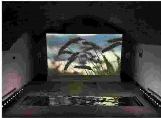
Due delle esposizioni diffuse realizzate per parallelaMente

L'odore di pioggia che ha rinfrescato l'aria e il passeggio di cretore nelle vie del centro, regala-