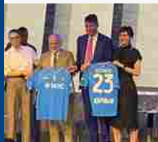
FOTO SHOW NM - NAPOLI, ECCO LA NUOVA MAGLIA AZZURRA SCUDETTATA CON MSC E EBAY