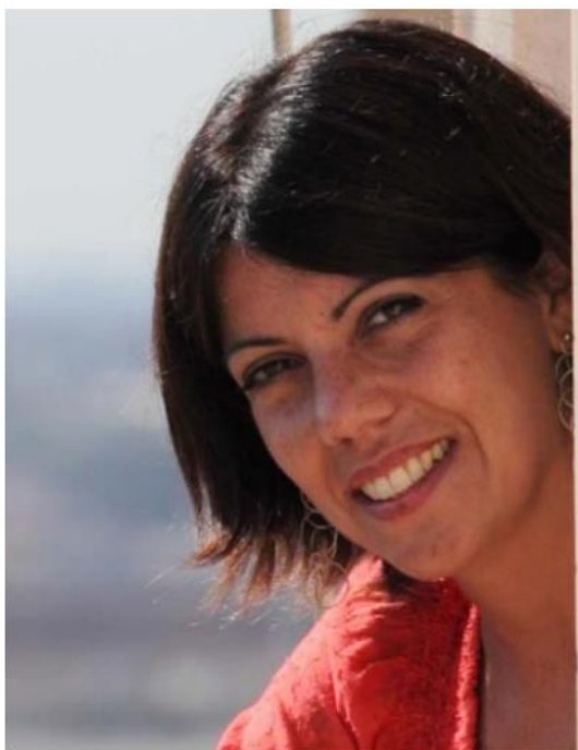
Gli scienziati al Festival della Mente di Sarzana 2-4 settembre

Gli scienziati al Festival della Mente di Sarzana 2-4 settembre, per la XIX edizione sono attesi 28 relatori