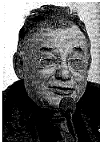
Il genetista Edoardo Boncinelli