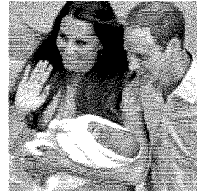
Opinioni Sopra William e Kate col piccolo George. Sotto Renzi e Blair al St. Regis