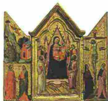
JACOPO DEL CASENTINO, Trittico portatile, tavola, a Pratovecchio Stia (Fi).

Con l'intento di portare all'attenzione del pubblico il patrimonio d'arte della provincia italiana, la mostra si svolge nel Casentino, luogo ricco di storia e di capolavori d'arte medievale e rinascimentale. Pratovecchio Stia (Fi). Teatro degli Antei, via Verdi. Tel. 055/294883. Orario: 15-19; sab e dom 10-13; 15-19. Ingresso: 6 euro; ridotto 4 euro. Fino al 19/10/2014.