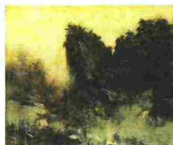
FRANCESCO DE GRANDI, Paesaggio con roccia, 2014, olio su tela.

Francesco De Grandi. Nei 40 dipinti esposti, alcuni di grandi dimensioni, tra paesaggi, ritratti, deserti silenziosi, naufragi spettacolari ed episodi della Passione, emerge l'inquietudine visionaria del pittore che si esprime attraverso immagini-archetipi per ritrovare simboli e significati. Per informazioni tel. 0923/713822. Orario: 10-13; 19-21. Fino al 26/10/2014.