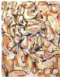
PIERO DORAZIO. Una breve visita, 1957, olio su tela esposto al Museo Archeologico di Aosta.

Prima uscita pubblica di una delle più ampie collezioni private di arte informale, che conta oltre 300 opere raccolte dal musicista Gian Piero Reverberi nell'arco di 30 anni. Fra i 90 dipinti esposti sono presenti lavori di artisti come Fautrier, Santomaso, Dorazio, Manzoni. Aosta. Museo Archeologico Regionale, piazza Roncas 12. Tel. 0165/274401. Orario: 10-18. Lunedì chiuso. Ingresso: 6 euro; ridotto 4 euro. Fino al 26/10/2014.