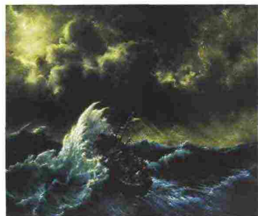
FRANCESCO DE GRANDI, Naufragio, 2014, olio su tela.

A MARSALA, in provincia di Trapani, il Convento del Carmine ospita le opere dell'artista palermitano