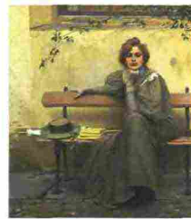
VITTORIO CORCOS. Sogni, 1896, tela in mostra a Padova.

L'antologica dedicata al pittore livornese Vittorio Corcos (1859-1933) presenta oltre 100 dipinti, fra i quali la sua opera più celebre intitolata "Sogni". Padova. Palazzo Zabarella, via San Francesco 27. Tel. 049/8753100. Orario: 9,30-19. Lunedì chiuso. Ingresso: 12 euro; ridotto 10 euro. Dal 6/9 al 14/12/2014.