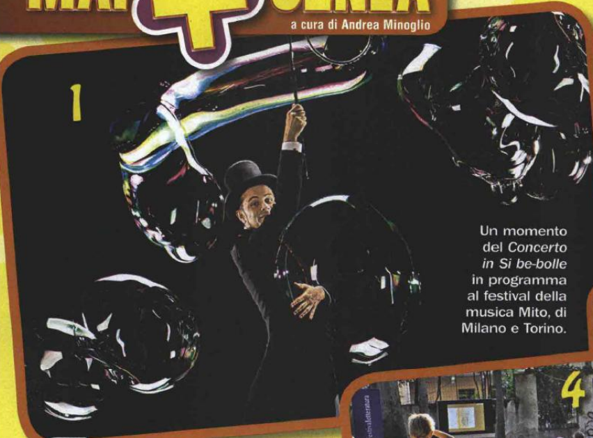
Un momento del Concerto in Si be-bolle in programma al festival della musica Mito, di Milano e Torino.