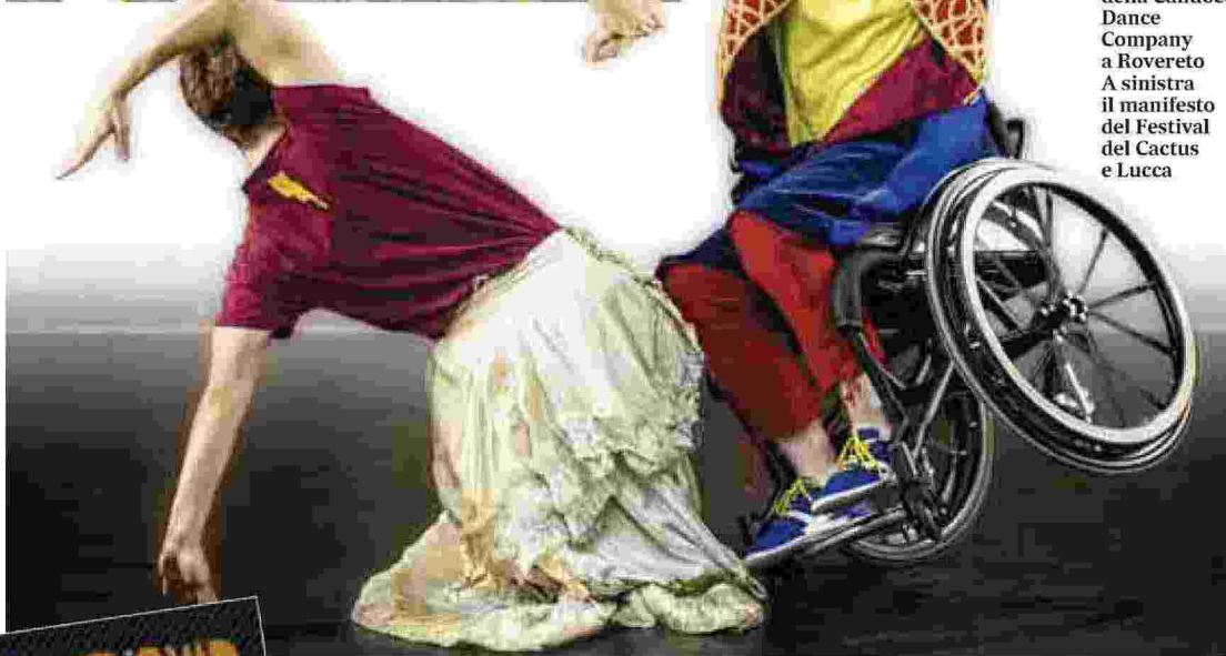
LA DANZA Spettacolo della Candoco Dance Company a Rovereto A sinistra il manifesto del Festival del Cactus e Lucca